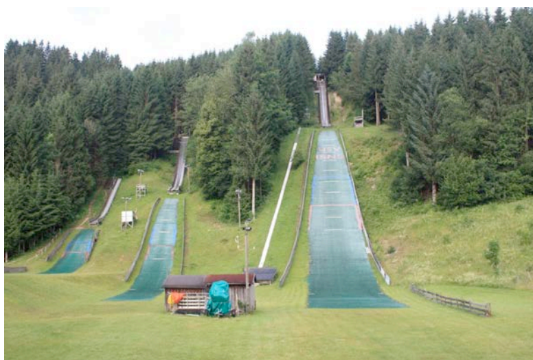
Isny im Allgäu