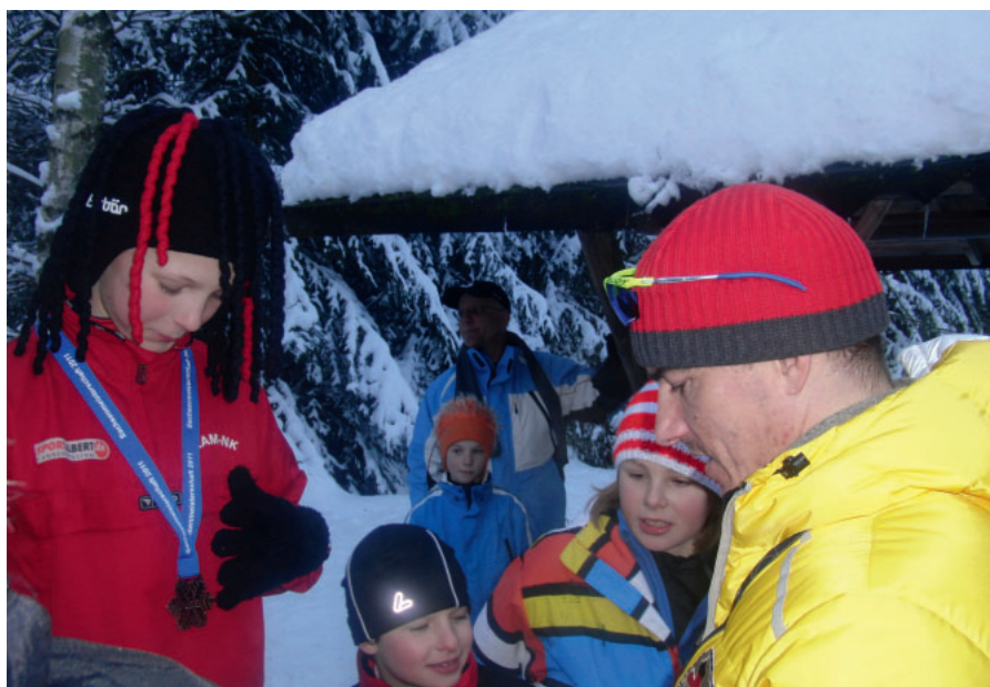
René Sommerfeldt nahm die Siegerehrung in Rodewisch vor.